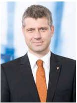
SZATMÁRY KRISTÓF, (Nemzetgazdasági Minisztérium, gazdaságyszabályozásért felelős államtitkár):

Az ilyen típusú vásárlások az üzleten kívül kötött szerződésekről szóló jogszabály hatálya alá tartoznak. Van lehetőség a szerződéstől való 8 napon belüli, indoklás nélkül történő elállásra. Abban az esetben viszont, ha a fogyasztó csak ezen határidő után szembesül azzal, hogy rossz üzletet kötött, a szerződéstől való elállásra nincs vagy csak nagyon komoly anyagi veszteség árán van lehetőség. Nem is beszélve arról, amikor a vevő telefonon jelzi, hogy el akar állni a vásárlástól, meg is nyugtatják, ám az eladók ezt később letagadják. A probléma súlyát mutatja, hogy a Nemzeti Fogyasztóvédelmi Hatóság vizsgálatai szerint a kifogásolási arány 80 százalék fölött van. Tisztelt Államtitkár Úr! Mit kíván tenni a kormány a megtévesztett nyugdíjas vásárlók védelme érdekében?