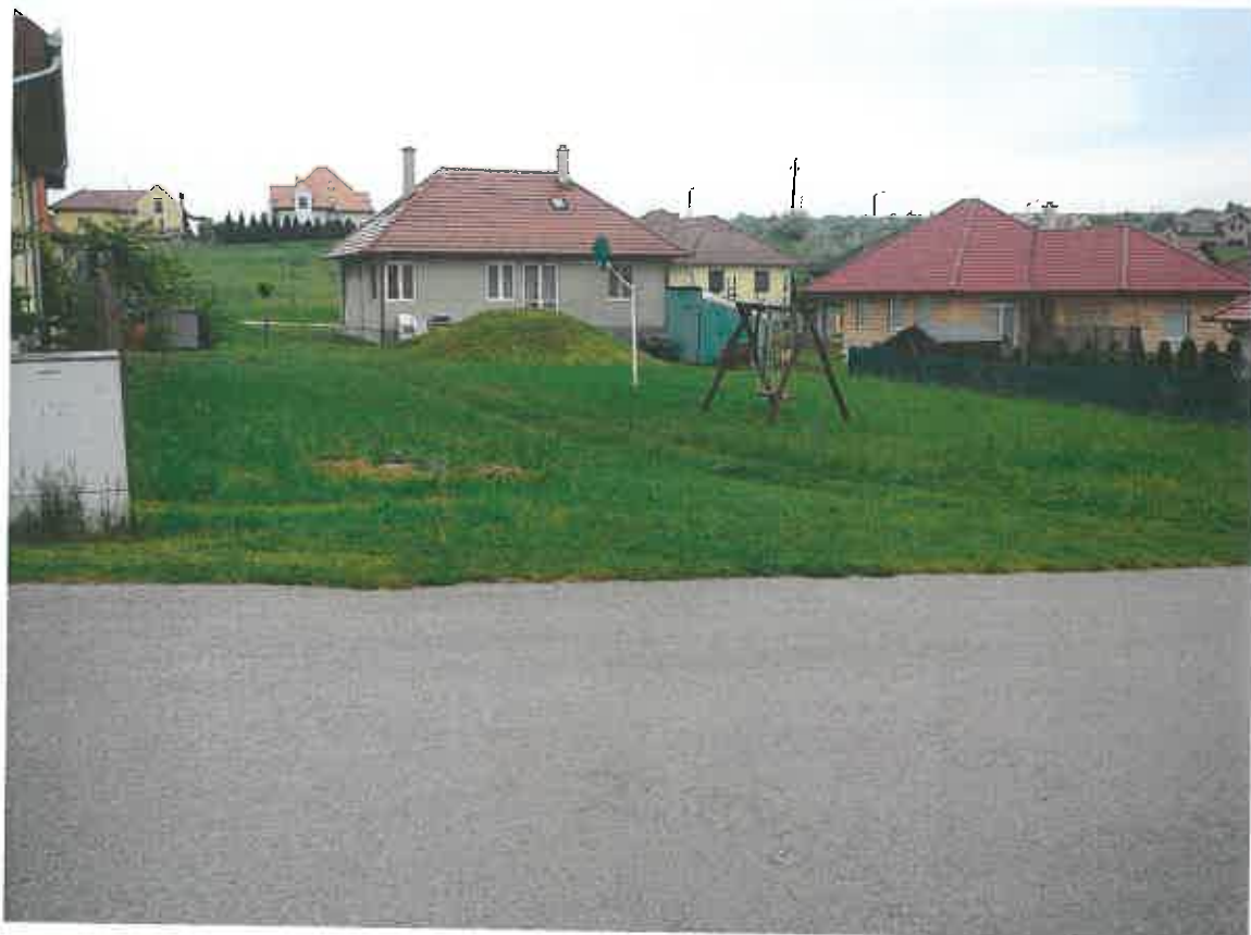
1. számú melléklet.