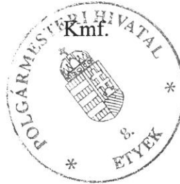
Porkoláb Éva jegyzőkönyvvezető