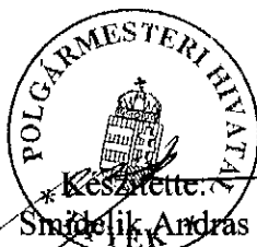
Készítette: Smódlík András