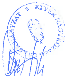
Danczinger Géza Bizottság/külsős tag Jegyzőkönyv-hitelesítő