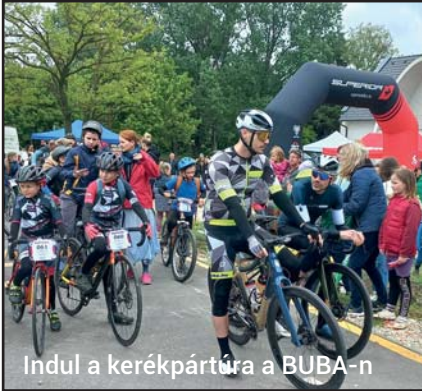
Indul a kerékpártúra a BUBA-n