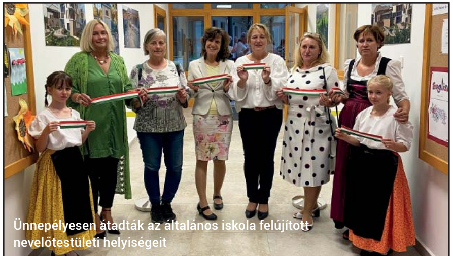
Ünnepélyesen átadták az általános iskola felújított nevelőtestületi helyiségeit

az Etyeki Németek Egyesületének köszönhetően a két település 1994-ben hivatalosan is megpecsételte Remshaldenben a testvérvárosi kapcsolatot, melynek megerősítésére egy évvel később Etyeken került sor.