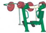
EE-02 Leg extension - Labtoló