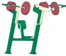
EE-03 Chest press - Melltoló