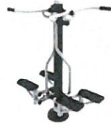
LE ST.014 Lépcsőző (lépegető)