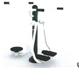
2340X-CSO kombinált derékmozgató és...