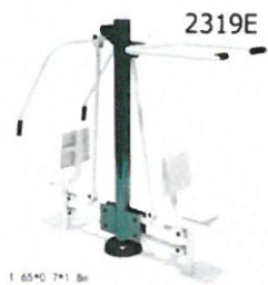
2319E - kombinált mellizom erősítő