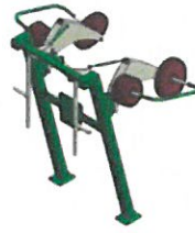
EE-05 Pec fly - Pillangó