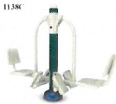
1138C-CSO - lábizom erősítő