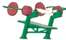
EE-04 Bench lift - Fekvenyomo