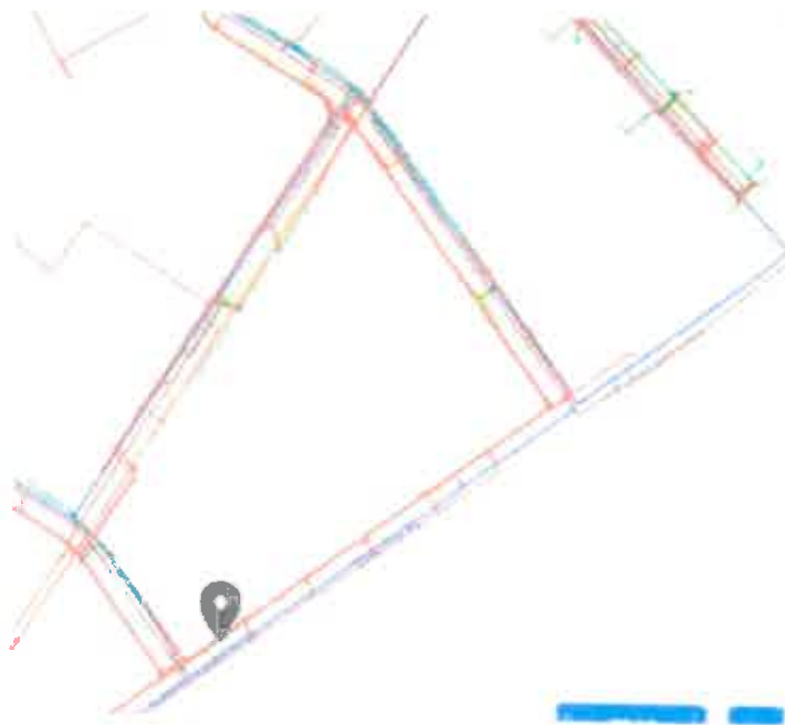
Közmű – 2.ábra