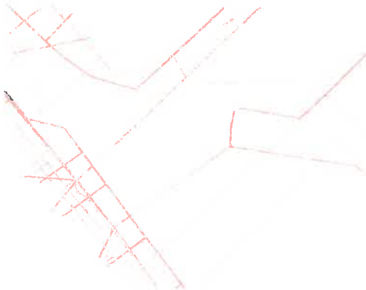
Közmű – 3.ábra