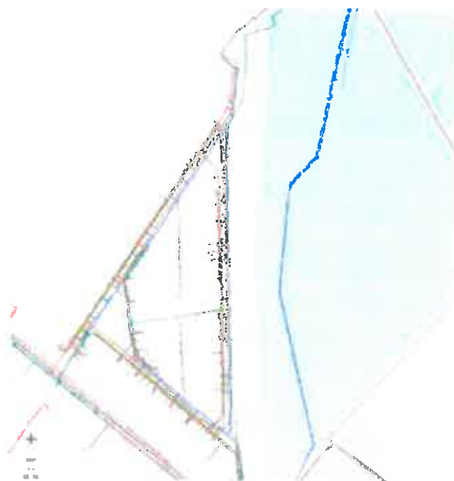
Közmű 4. ábra