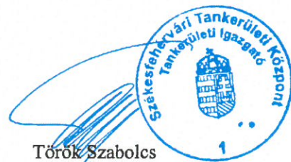
Török Szabolcs tankerületi igazgató